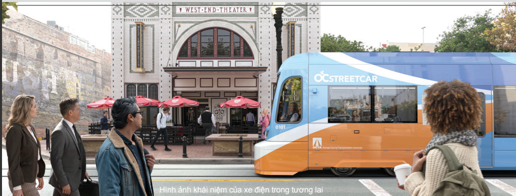
Hình ảnh khái niệm của xe điện trong tương lai